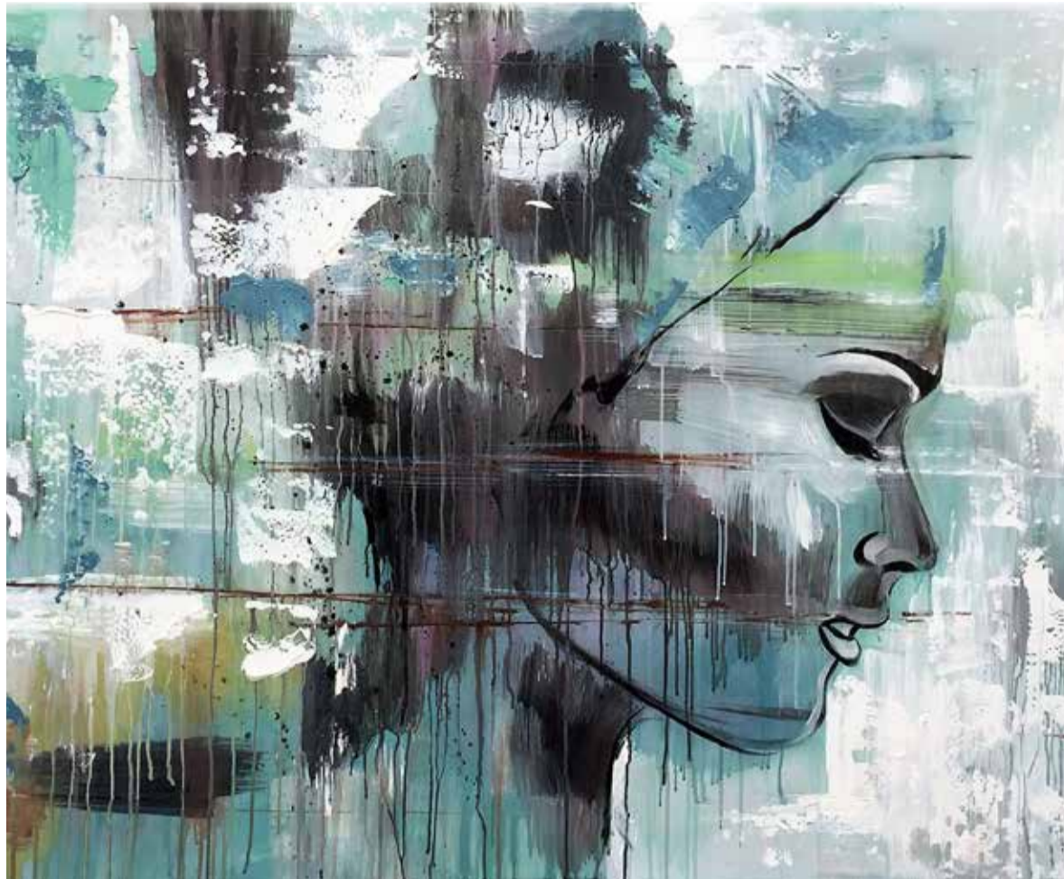
SCHILDERIJ VIA BESTPAINTINGS.NL

wa-ak en bid’. Ik voelde sterk de aandrang om op te staan en te gaan bidden. Maar rationeel als ik was, dacht ik: ‘Wat een onzin. Ik ben moe en morgen heb ik weer een drukke dag.’ En ik ging weer slapen. De volgende ochtend hoorde ik dat mijn grootvader inderdaad was overleden. Een tijdje na zijn overlijden viel de lamp in mijn studeerkamer uit, terwijl ik mijn preek aan het schrijven was. Morrelend aan de lamp, dacht ik na over de passage die ik zojuist had geschreven. Mijn opa kwam in mijn gedachten op. Als predikant zou hij, met zijn nadruk op genade, dit beslist anders hebben verwoord. Het morrelen hielp niet, maar mijn bureaulamp gaf ook licht; ik ging dus maar gewoon verder. Ik herschreef de tekst die ik zojuist had geschreven, in gedachten aan mijn opa, en de lamp floepte weer aan! Een aantal jaren heb ik het gevoel gehad dat mijn opa mij begeleidde bij het schrijven van de preken. Wanneer ik al te eigengereid werd in mijn preektekst, in de trant van: ‘we brengen het Koninkrijk van God zelf tot stand’, ging letterlijk het licht uit. Als ik vervolgens de tekst herschreef en recht deed aan de diepe